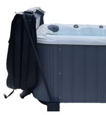
LÈVE-COUVERTURE FIXATION SOUS SPA

Réf : ESC002 Escalier 2 marches composite noir