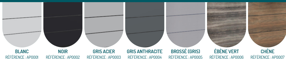
BLANC RÉFÉRENCE : AP0001