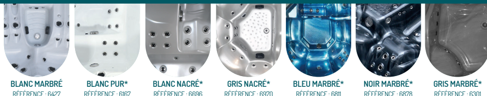
BLANC MARBRÉ RÉFÉRENCE : 6427