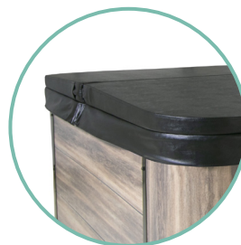
COUVERTURE ISOLANTE INCLUSE