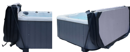
LÈVE-COUVERTURE FIXATION SOUS SPA