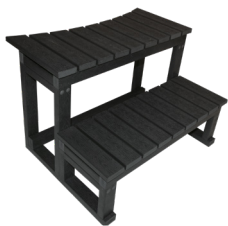
ESCALIER ROND 2 MARCHES

RÉF : ESC005 Escalier 2 marches rond composite gris