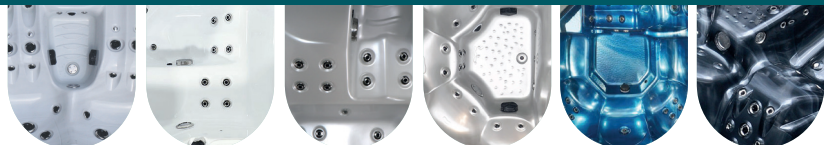
BLANC MARBRÉ RÉFÉRENCE : 6427