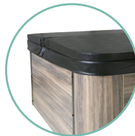
COUVERTURE ISOLANTE INCLUSE