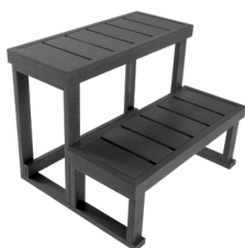
ESCALIER 2 MARCHES

RÉF : ESC001 Escalier 2 marches composite gris