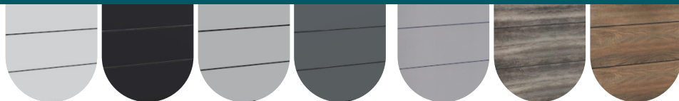
ALUMINIUM BLANC RÉFÉRENCE : AP0001 ALUMINIUM NOIR RÉFÉRENCE : AP0002 ALUMINIUM GRISACIER RÉFÉRENCE : AP0003 ALUMINIUM GRIS ANTHRACITE RÉFÉRENCE : AP0004 ALUMINIUM BROSSÉ (GRIS)* RÉFÉRENCE : AP0005 ALUMINIUM ÉBÈNE VERT RÉFÉRENCE : AP0006 ALUMINIUM CHÊNE RÉFÉRENCE : AP0007

* COLORIS SUR COMMANDE. AUTRES COULEURS DISPONIBLES SUR LE SITE WWW.BE-SPA.FR