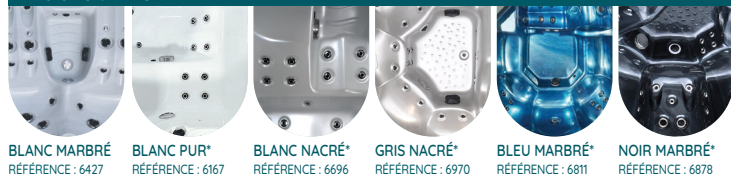
BLANC MARBRÉ RÉFÉRENCE : 6427 BLANC PUR* RÉFÉRENCE : 6167 BLANC NACRÉ* RÉFÉRENCE : 6696 GRIS NACRÉ* RÉFÉRENCE : 6970 BLEU MARBRÉ* RÉFÉRENCE : 6811 NOIR MARBRÉ* RÉFÉRENCE : 6878