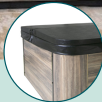
COUVERTURE ISOLANTE INCLUSE