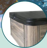
COUVERTURE ISOLANTE INCLUSE