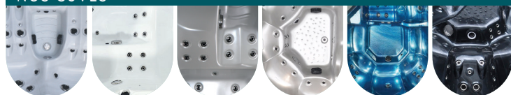
BLANC MARBRÉ RÉFÉRENCE : 6427 BLANC PUR* RÉFÉRENCE : 6167 BLANC NACRÉ* RÉFÉRENCE : 6696 GRIS NACRÉ* RÉFÉRENCE : 6970 BLEU MARBRÉ* RÉFÉRENCE : 6811 NOIR MARBRÉ* RÉFÉRENCE : 6878