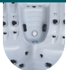
BLANC MARBRÉ RÉFÉRENCE : 6427