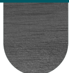
COMPOSITE GRIS ARDOISE RÉFÉRENCE : CP0003