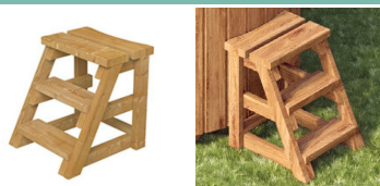
ESCALIER EN BOIS 3 MARCHES